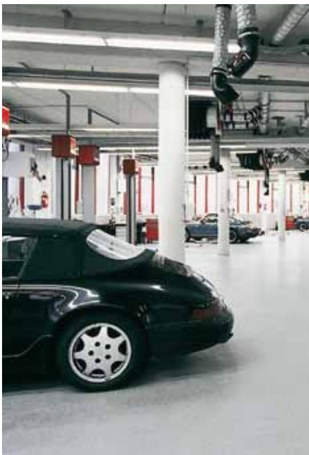
Porsche Zentrum, Mannheim