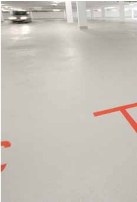
Vector Informatik, Stuttgart-Weilimdorf