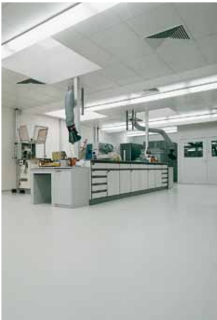
Reinraum in der Pharma-Industrie