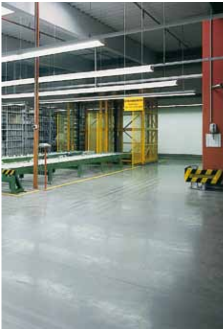
Maico Elektro Apparate-Fabrik GmbH, Villingen Schwenningen