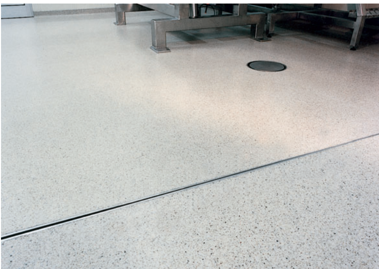
Baudehnungsfugen werden in Kunstharzbeton eingebaut.