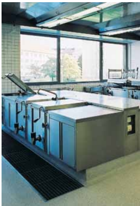
Großküche der Mensa der Universität Chemnitz