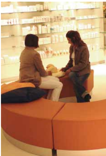
Apotheke am Theater, Esslingen