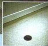
Weiterer Vorteil: Runde Bodenabläufe minimieren die Ribbildung.

in der Großküche verlangt die Lebensmittelverordnung, u. a. auch die Gewerbeaufsicht, verstärkt fugenlose Bodenbeläge. Das Reinigen von Kochgeräten, wie beispielsweise Kippbratpfannen, erfolgt mit heißem Wasser. Wird dabei das Schmutzwasser in das Entwässerungssystem entleert, dehnt sich bei einer Temperatur von 70 °C eine Kastenrinne in V 2 A-Stahl auf einem Meter Länge um 1,1 mm aus. Bei 140 °C dehnt sich diese Rinne auf drei Meter Länge bereits um 6,72 mm aus. Die Bodenkonstruktion bleibt hingegen relativ starr. In einer Großküche sind jedoch die mechanischen Beanspruchungen an die Druckfestigkeit und die Schlagzähigkeit des Bodens ausgesprochen hoch. Und schwere Spülmaschinen fordern einen druckfesten Bodenbelag.