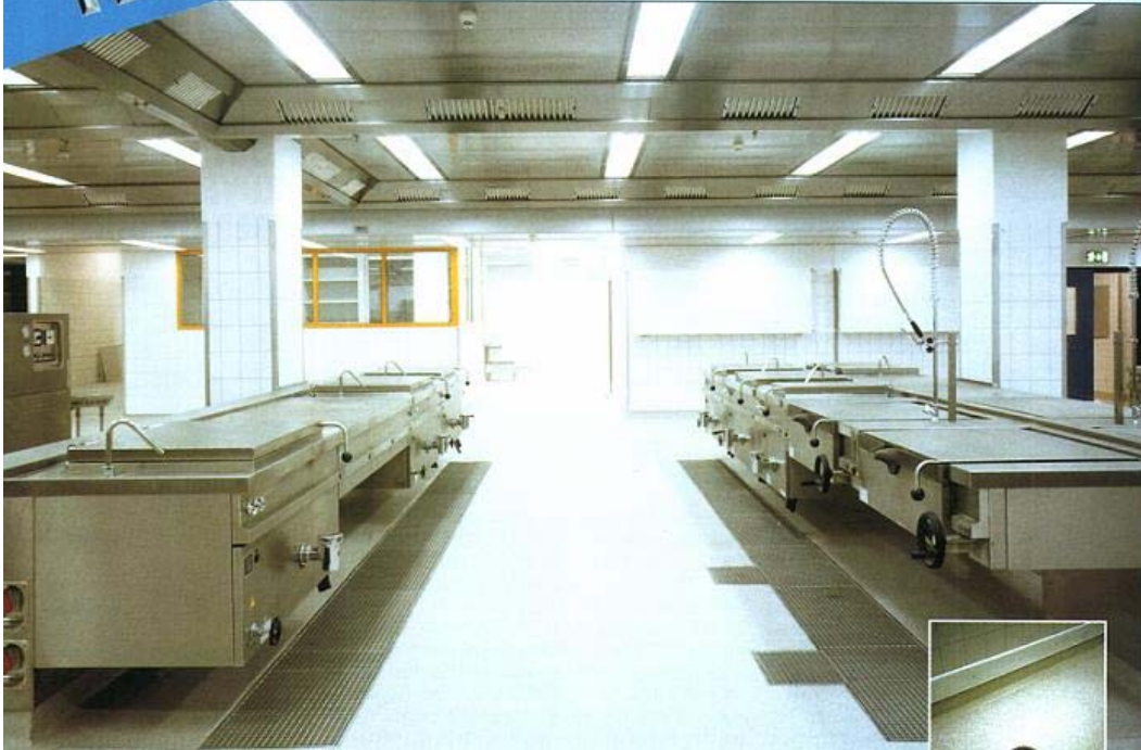
Neuer Fußboden in Mensaküche: