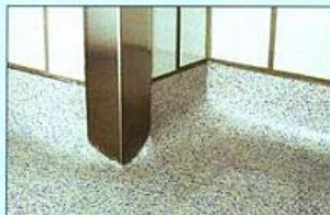
Ein Vorteil eines Küchenbodens auf Kunstharzbasis im Detail: Die Hohlkehlsoclel wurden in glatter Ausführung exakt von Hand modelliert.

Im Rahmen der Gesamtsanierung der Mensa Uniwiese (Zentralmensa) des Kölner Studentenwerks 1997/98 wurde auch die Mensa-Küche komplett erneuert. Dabei stand im Mittelpunkt die Fehlerquellen des Küchenbodens so weit wie irgend möglich zu minimieren. Um dies zu erreichen, entschloß man sich, die gesamte Küche – mit nahezu 2.200 m 2 Fläche – mit einem fugenlosen Küchenboden auf Kunstharzbasis auszustatten.