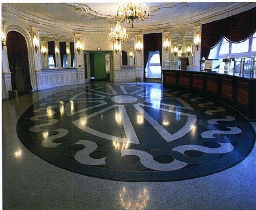
Museums-Terrazzo appliziert sternenförmig, Körnungen: lichtgrün und saphirblau.