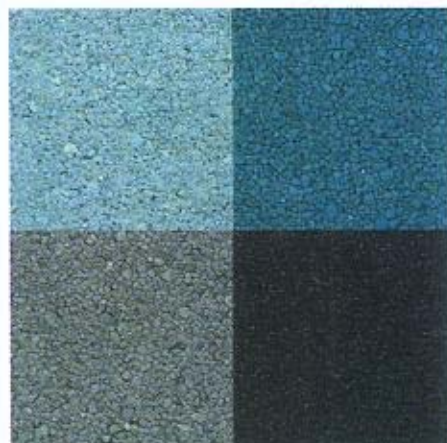
Moderne monochrome Terrazzo-Körnungen.