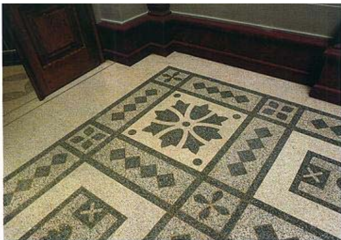
Intarsien-Terrazzo in einem klassisch-eleganten Design, Körnungen: schwarz, grün, grauweiss.