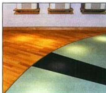
Die Hohlkehlen werden von Hand modelliert (li.). Der Übergang zwischen den Belägen ist fugenlos (re.).

Wie schön, dass es noch anspruchsvolle Kunden gibt.