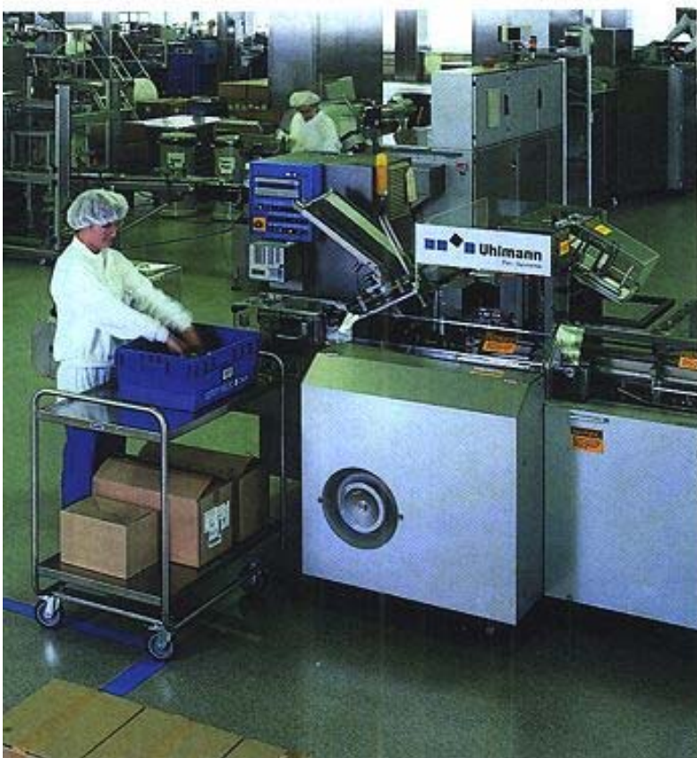
Bild 1: Ein fugenloser Bodenbelag bietet hygienische und mikrobielle Sicherheit