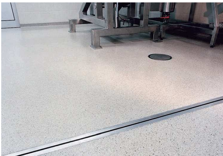
Канализационные трапы монтируются с применением высокопрочного синтетического бетона.