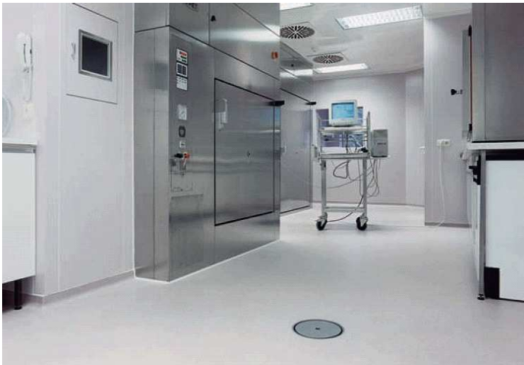
Канализационные трапы монтируются с применением высокопрочного синтетического бетона.