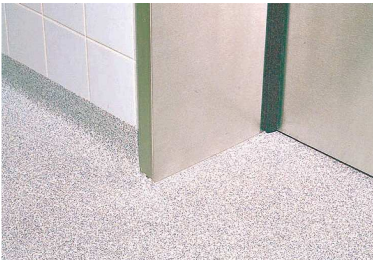
Плинтус прирабатан к дверной коробке операционной