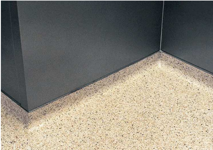
Закруглённые плинтуса вручную прирабатываются к стене фармацевтического, чистого или операционного помещения.