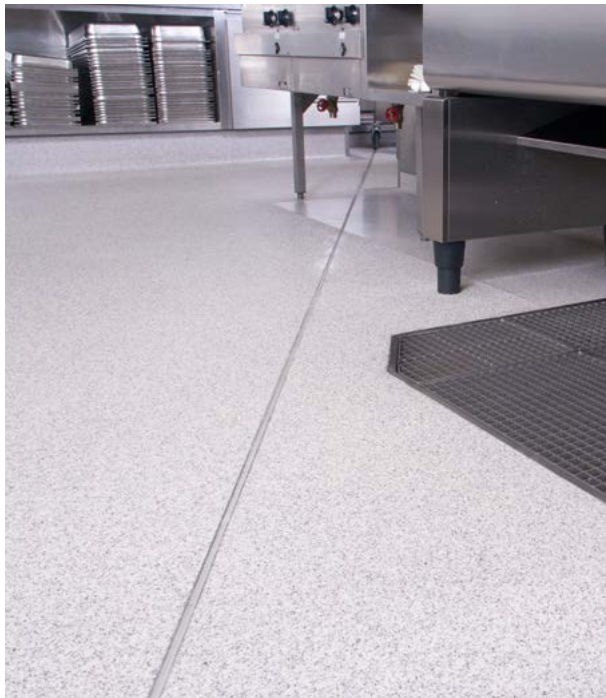
Baudehnungsfugen werden in Kunstharzbeton eingebaut.