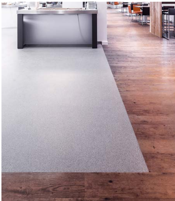
Belagswechsel von BARiT-KH-Belag zu Parkett