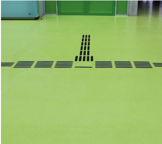
Abzweigungsfelder zum Aufzug