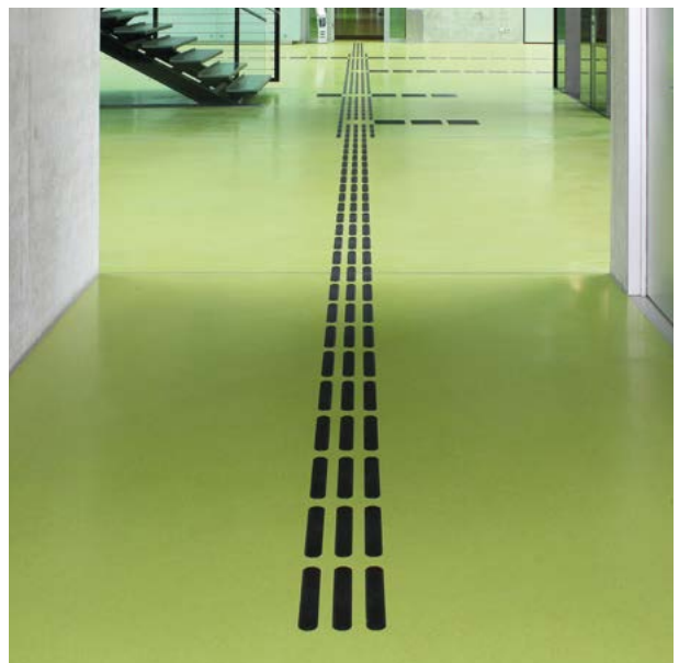
Nachträglicher Einbau in der TU Dresden