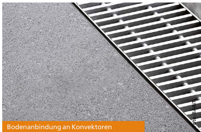
Bodenanbindung an Konvektoren