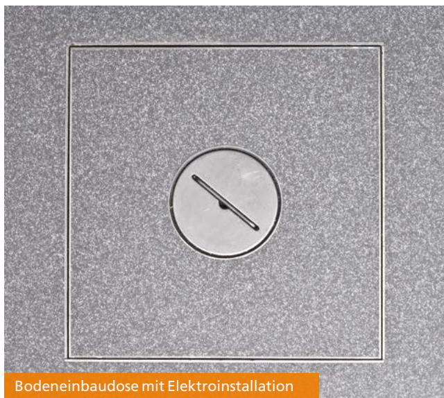
Bodeneinbaudose mit Elektroinstallation

Der MUSEUMS-TERRAZZO eignet sich aufgrund seiner Belastungsfähigkeit für stark frequentierte Bereiche aufgrund des hohen Verschleißwiderstandes. Durch die Oberfläche ist er auch bei permanenter Belastung durch Stuhlrollen abriebarm. Durch die fugenlose Oberfläche des MUSEUMS-TERRAZZO läßt sich der Belag leicht reinigen und pflegen.