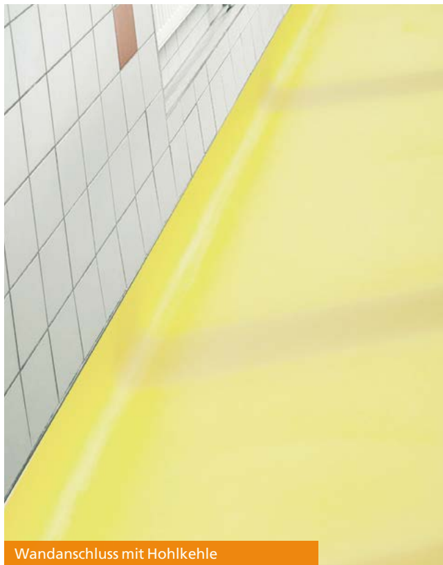
Wandanschluss mit Hohlkehle

Die Temperaturbelastung liegt kurzzeitig bei 120 °C, konstant bei 40 °C.