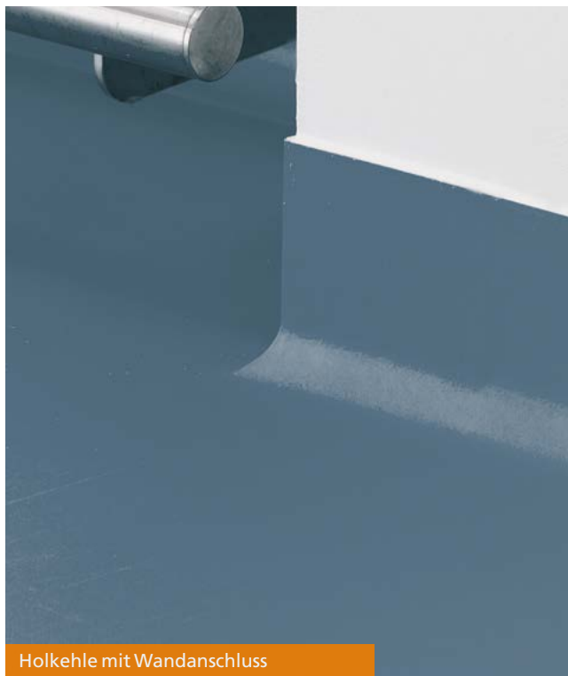
Holkehle mit Wandanschluss

Aufgrund der Schichtdicke von 2 – 3 mm besitzt der POWER-BELAG eine gute mechanische Festigkeit. Die POWER-Beschichtung wird in einer Schichtdicke von 1,5 mm eingebaut und ist daher ein kostengünstiger Industrieboden. Die Temperaturbelastung liegt kurzzeitig bei 120 °C, konstant bei 40 °C.