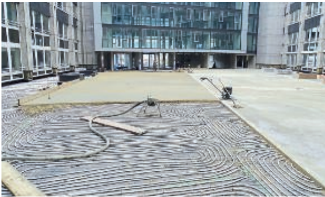
Innenfläche der Eingangshalle: Flächengröße ca. 1.400 m 2 , Fußbodenheizung. Bewegungsfugen in der Fläche werden nicht benötigt und wurden auch nicht ausgebildet. Die täglich entstandenen Arbeitsfugen sind zunächst als Pressfugen ausgebildet worden.