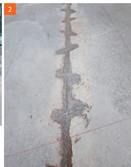
2 Die Arbeitsfugen wurden der Länge nach ca. 35 mm tief aufgeschnitten. Alle Fugen sind mit einem 2K-Epoxidharz kraftschlüssig beseitigt worden.