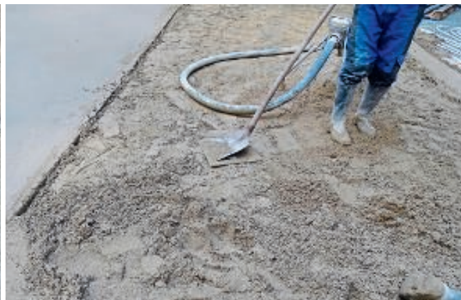
Der Estrichmörtel ist von beiden eingesetzten Estrichkolonnen zwischenverdichtet worden. Es kam entscheidend auf die hohe Qualität der Estrichverteilschicht an.

mörtel der Firma Thermotek erforderlich waren.