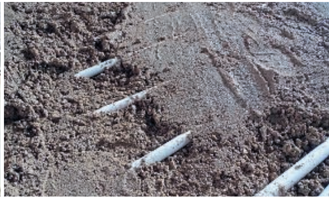
Der Estrichmörtel, hergestellt mit dem Bindemittel A58 der Ardex GmbH, ist in einer plastischen Konsistenz verarbeitet worden. In das Tragverhalten der Estrichlastverteilschicht wurden auch die Estrichbereiche zwischen den Heizrohren mit einbezogen.