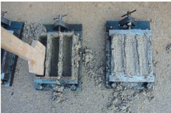
Die Biegezugfestigkeit des verwendeten Estrichmörtels wurde an den Mörtelprismen nach DIN EN 13892-2 mit 7 N/mm 2 erreicht.