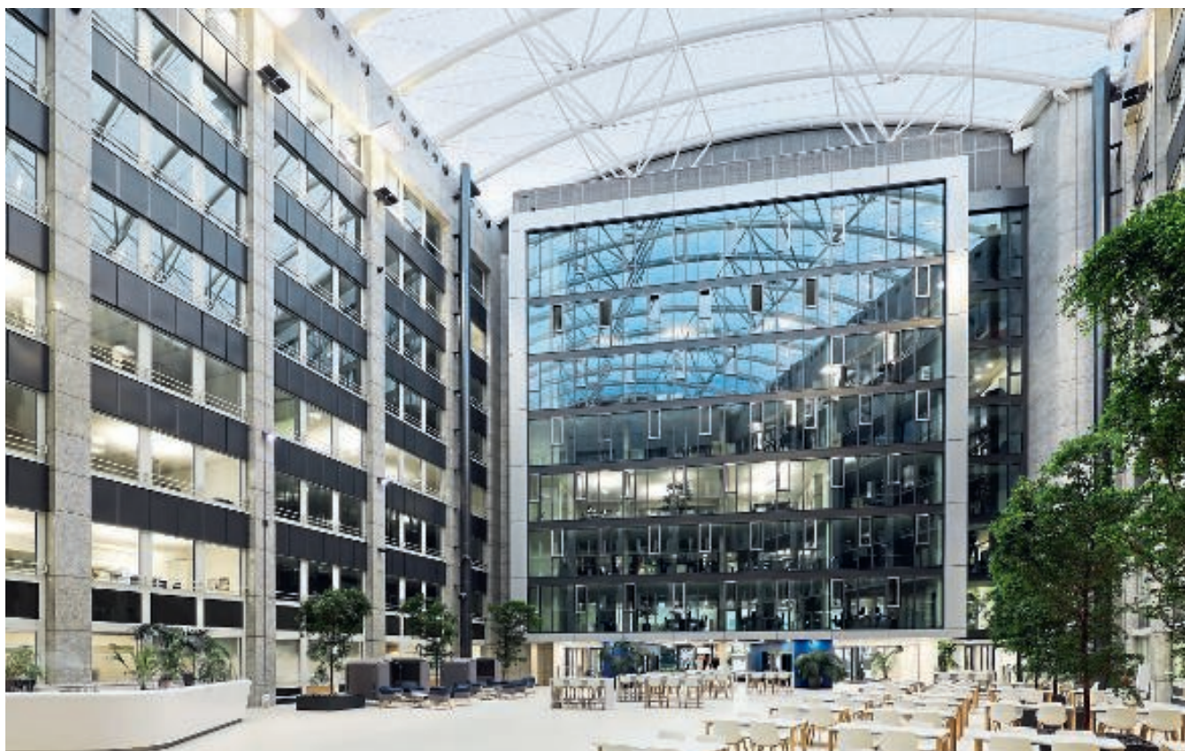
Ein in jeder Hinsicht gelungenes Werk u.a. der BGF+Architekten.

Am neuen Standort der Helaba im Offenbacher Main Park empfängt eine repräsentative Eingangshalle Mitarbeiter und Besucher. Die Umsetzung der fugenlosen Fußbodenkonstruktion entspricht formal nicht der DIN 18560, Teil 2. Der hohen Qualität der Leistungsumsetzung tut dies jedoch keinen Abbruch.