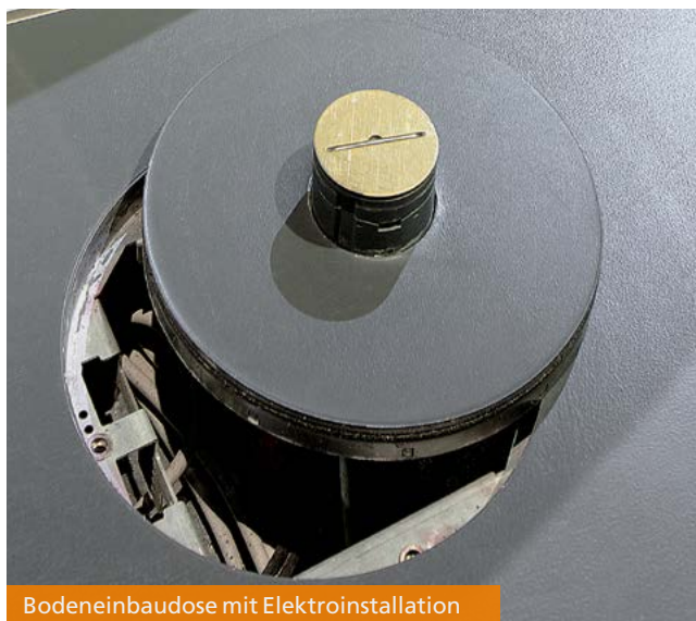
Bodeneinbaudose mit Elektroinstallation